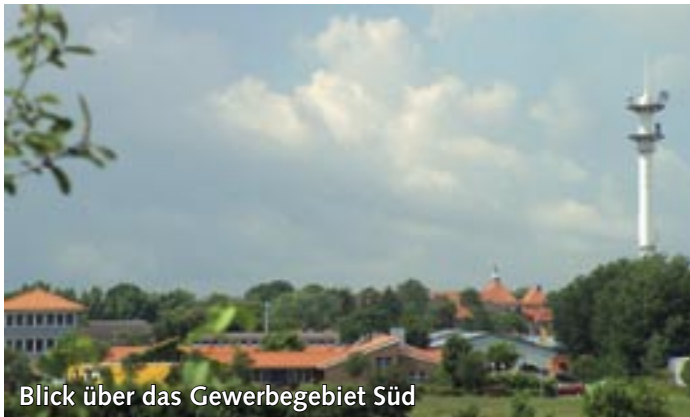
Blick über das Gewerbegebiet Süd