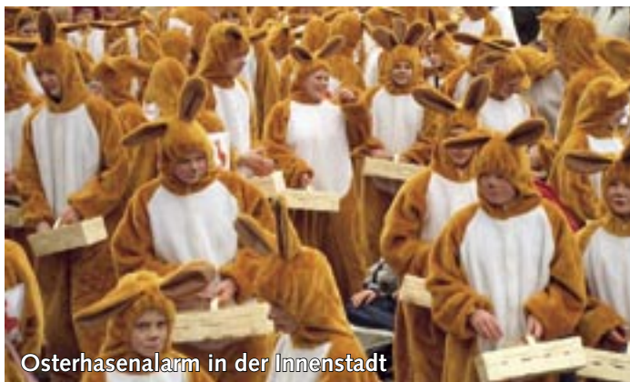
Osterhasenalarm in der Innenstadt