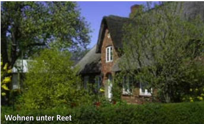
Wohnen unter Reet