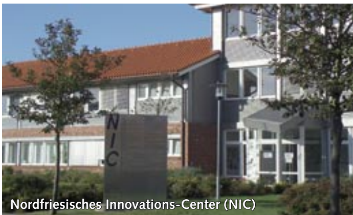
Nordfriesisches Innovations-Center (NIC)