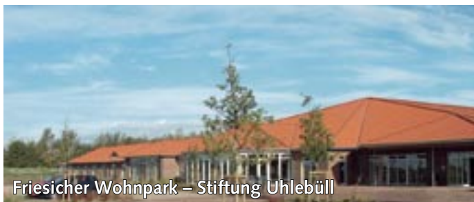
Friesischer Wohnpark – Stiftung Uhlebüll