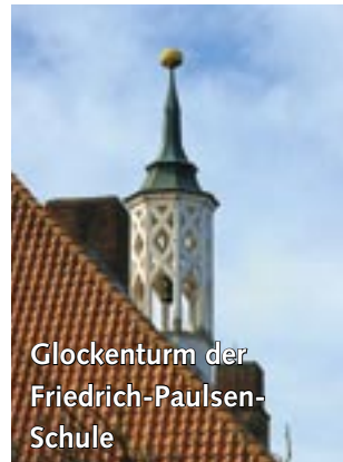
Glockenturm der Friedrich-Paulsen- Schule